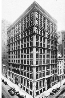
Imagen 3 en Wikipedia. Dominio Público