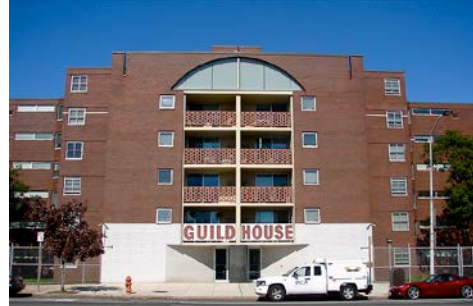
Imagen 4 en Wikipedia. Lic. CC0 1.0