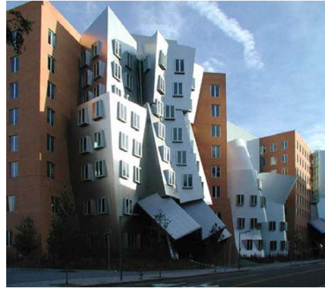
Imagen 2