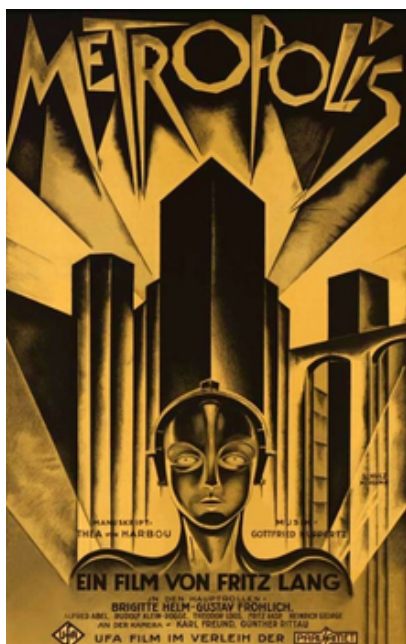
Metrópolis. Fritz Lang